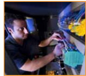
Asistencia y servicio técnico internacional

Nuestro personal experto tiene la dedicación y la experiencia necesaria en aplicaciones para garantizar una integración perfecta sin problemas de nuestras tecnologías pioneras en sus sistemas de fabricación. También tiene la garantía de que recibirá nuestro apoyo y colaboración tras la instalación inicial, y la certeza de que obtendrá el máximo beneficio de su compra en Renishaw mediante un servicio técnico de aplicaciones continuado y una serie de paquetes de servicio que mantendrán su sistema en condiciones óptimas, preparado para su próximo reto de fabricación.