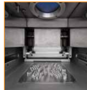
Cámara de fabricación de fundición por láser