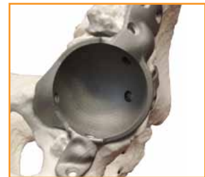
Modelos de implantes de cadera

La capacidad para procesar con seguridad materiales reactivos, como titanio y aluminio, es una característica de serie en todas las máquinas de fundición por láser de Renishaw, con sistemas seguros de procesamiento de emisiones y manipulación de polvo. Los usuarios de máquinas de fundición por láser también se benefician de una merma mínima del producto, ya que es posible reciclar hasta un 98% del material tras su refinado en los sistemas de acondicionamiento de polvo de Renishaw.