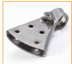
Componente de motor de competición