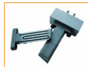
Herramienta con refrigeración conforme