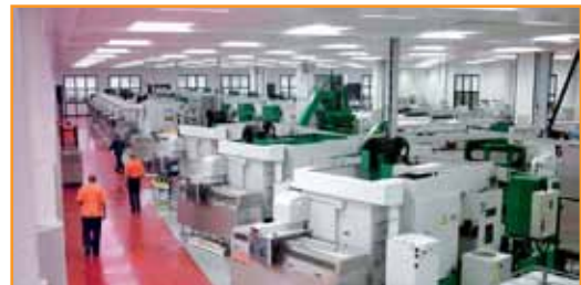
Talleres de categoría internacional de Renishaw en Gloucestershire, R.U.

Desde prototipos con canales de refrigeración a estructuras ligeras para aplicaciones aeroespaciales y de alta tecnología, la fundición por láser proporciona más libertad de diseño a los diseñadores para generar estructuras y formas optimizadas que, de otro modo, estarían restringidas por procedimientos convencionales o requisitos de útiles para grandes series. La fundición por láser es complementaria a las tecnologías de fabricación convencionales y forma parte del sistema de fabricación, incluido el tratamiento térmico y el post-proceso de las superficies, y contribuye directamente a la reducción de los plazos de entrega, costes de utillajes y material de desecho.